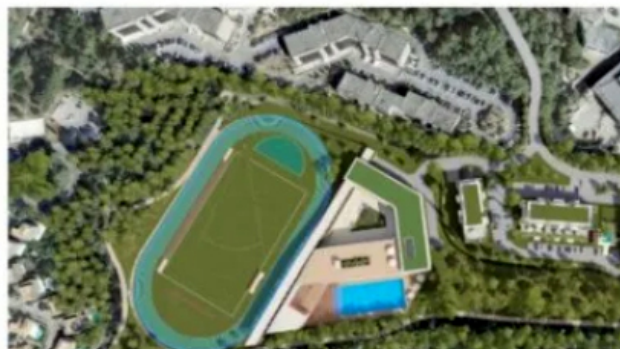
Mougins - Domaine du Pigeonnier - Campus Diagana