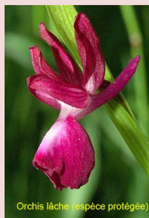
Orchis lâche (espèce protégée)

Voir les documents détaillés sur notre site.