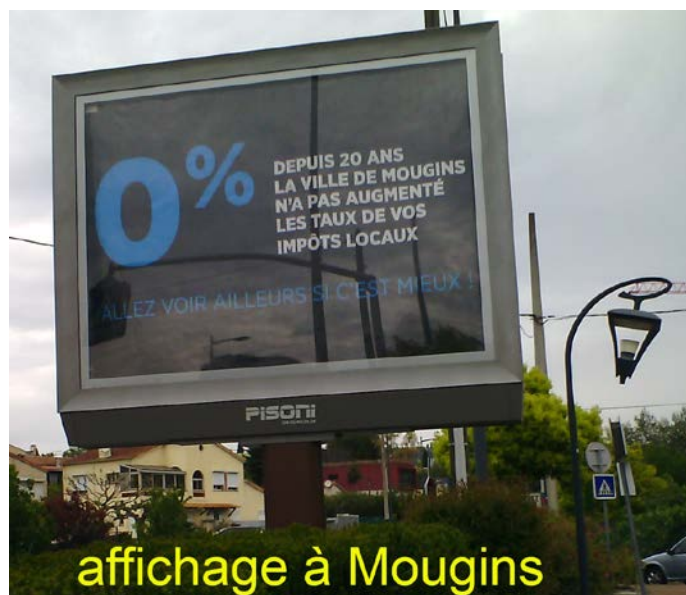
affichage à Mougins

Que voilà un argumentaire élégant et respectueux de ses administrés ! Dans le pire des cas, il signifie : « déménagez ! », et, au mieux : « informez-vous ! »... mais ne comptez pas sur la municipalité pour vous informer !